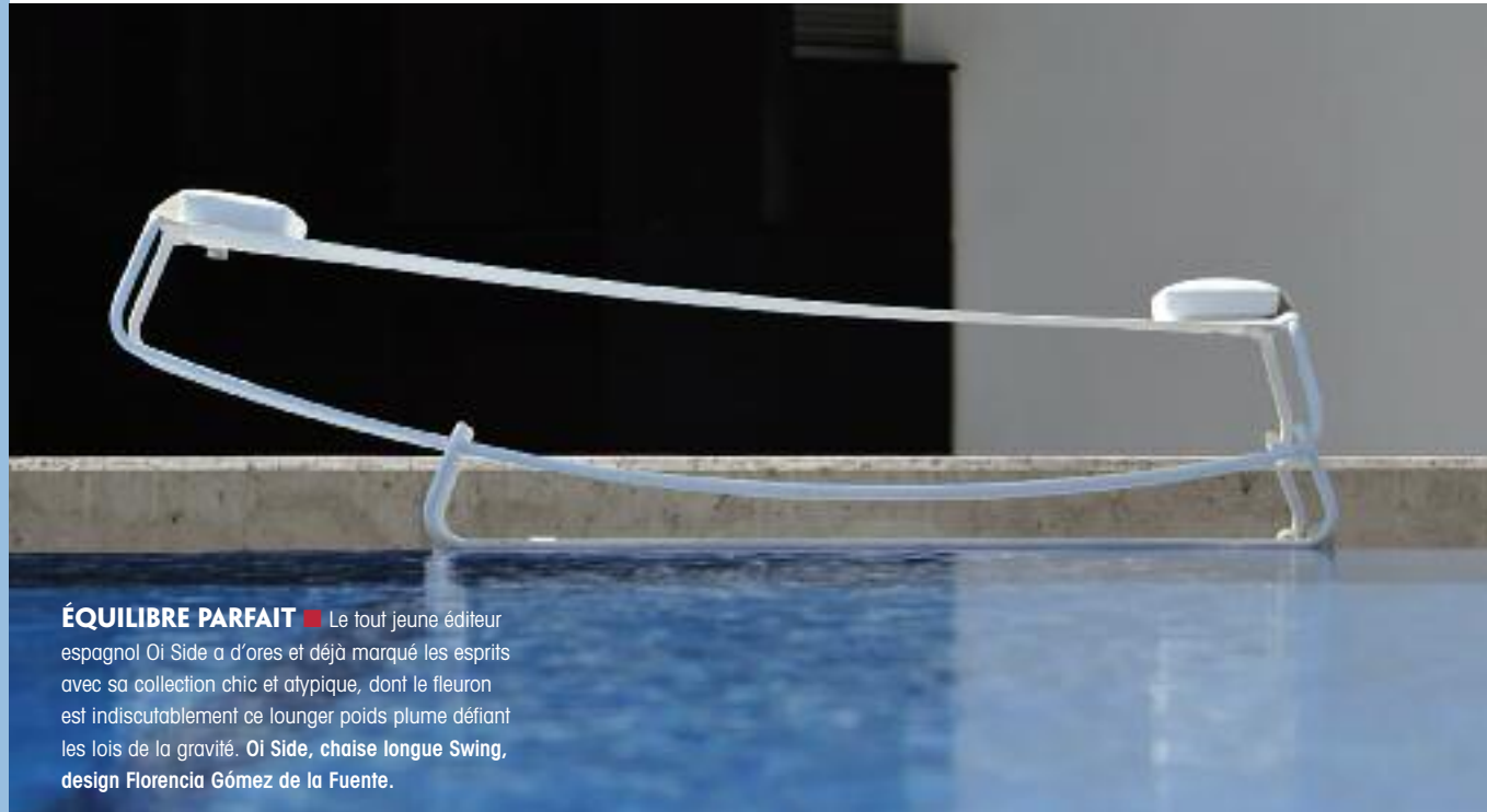
ÉQUILIBRE PARFAIT ■ Le tout jeune éditeur espagnol Oi Side a d'ores et déjà marqué les esprits avec sa collection chic et atypique, dont le fleuron est indiscutablement ce lounge poids plume défiant les lois de la gravité. Oi Side, chaise longue Swing, design Florencia Gómez de la Fuente.