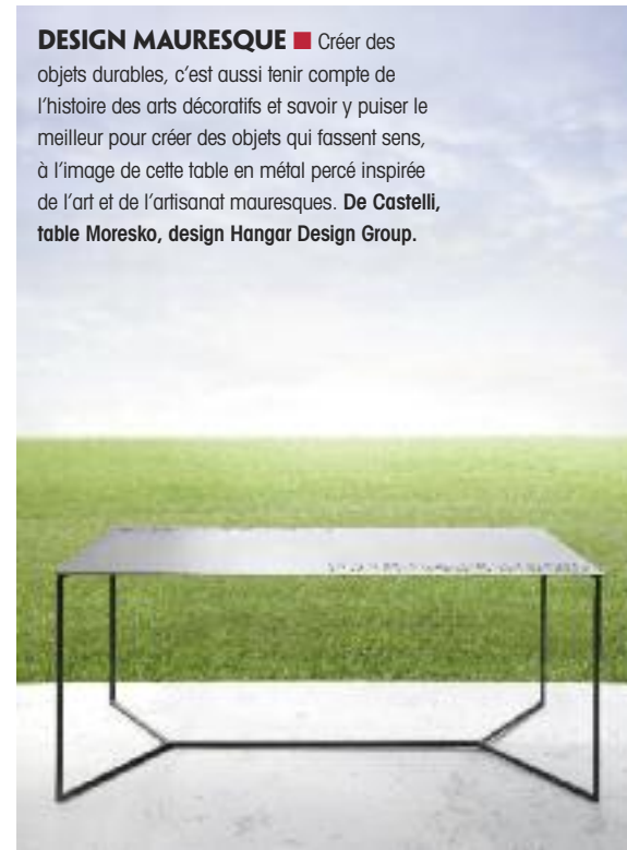
DESIGN MAURESQUE ■ Créer des objets durables, c'est aussi tenir compte de l'histoire des arts décoratifs et savoir y puiser le meilleur pour créer des objets qui fassent sens, à l'image de cette table en métal percé inspirée de l'art et de l'artisanat mauresques. De Castelli, table Moresko, design Hangar Design Group.

4 CHIC CHINE ■ La porcelaine, surnommée autrefois l'or blanc, est encore travaillée par des artisans chinois exigeants, auxquels a fait appel le designer Stefan Schöning pour réaliser les pots – surmontés de treilles en fils de fer laqués – et les plateaux de table de sa collection Whitegold, afin de tordre le cou à tous les préjugés. Whitegold by Domani, collection Whitegold.