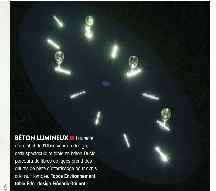
BÉTON LUMINEUX ■ Lauréate d'un label de l'Observateur du design, cette spectaculaire table en béton Ductal parcouru de fibres optiques prend des allures de piste d'atterrissage pour ovnis à la nuit tombée. Topos Environnement, table Edo, design Frédéric Gaunet.