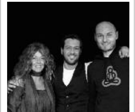
Créateur de l'emblématique tulipe de MyYour, le studio Moredesign milite pour le retour de l'optimisme au jardin.

« Des objets ludiques pour détendre l'atmosphère »