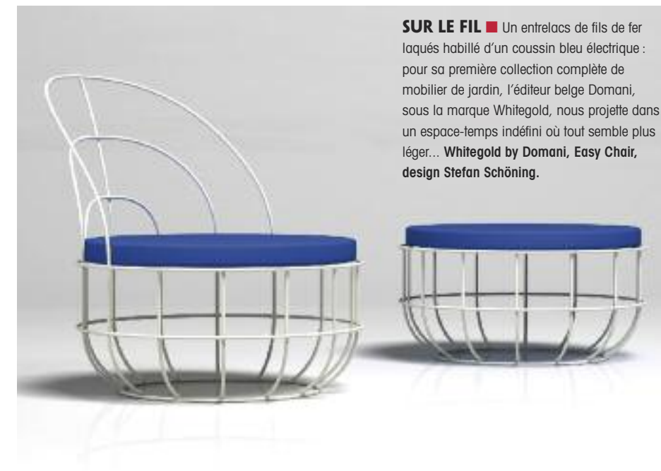
SUR LE FIL ■ Un entrelacs de fils de fer laqués habillé d'un coussin bleu électrique : pour sa première collection complète de mobilier de jardin, l'éditeur belge Domani, sous la marque Whitegold, nous projette dans un espace-temps indéfini où tout semble plus léger... Whitegold by Domani, Easy Chair, design Stefan Schöning.

5 NOUVELLES PERSPECTIVES ■ Adepte des structures aériennes, le designer Carlo Colombo repousse les limites du métal, matériau fétiche de l'éditeur Emu, en proposant une collection aux formes modernes et légères. Emu, collection Intrecci, design Carlo Colombo.