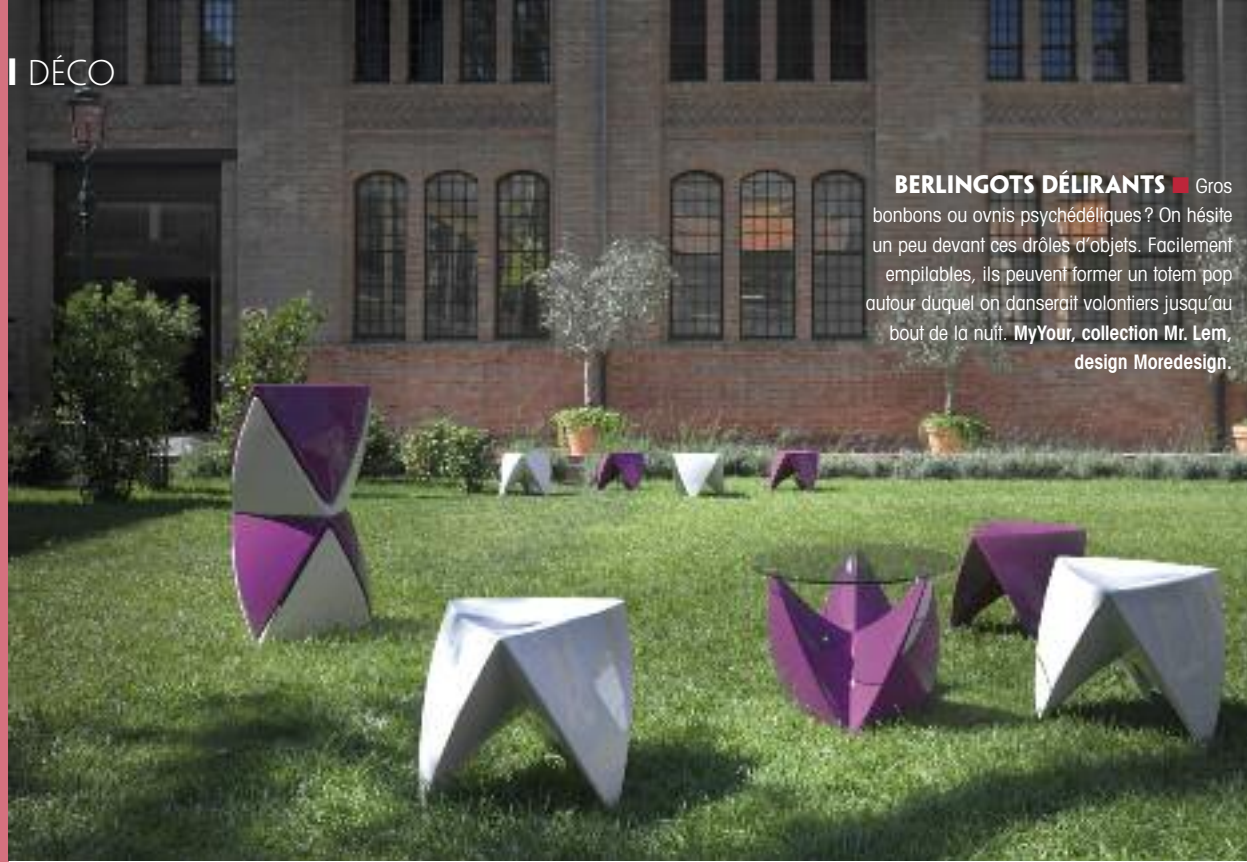
BERLINGOTS DÉLIRANTS ■ Gros bonbons ou ovnis psychédéliques ? On hésite un peu devant ces drôles d'objets. Facilement empilables, ils peuvent former un totem pop autour duquel on danserait volontiers jusqu'au bout de la nuit. MyYour, collection Mr. Lem, design Moredesign.

Le design anticrise arrive enfin au jardin. Vert acide, violet cassis, orange vif ou jaune pétard : tous les coloris sont permis, pourvu qu'ils soient au service de formes pop et ludiques.