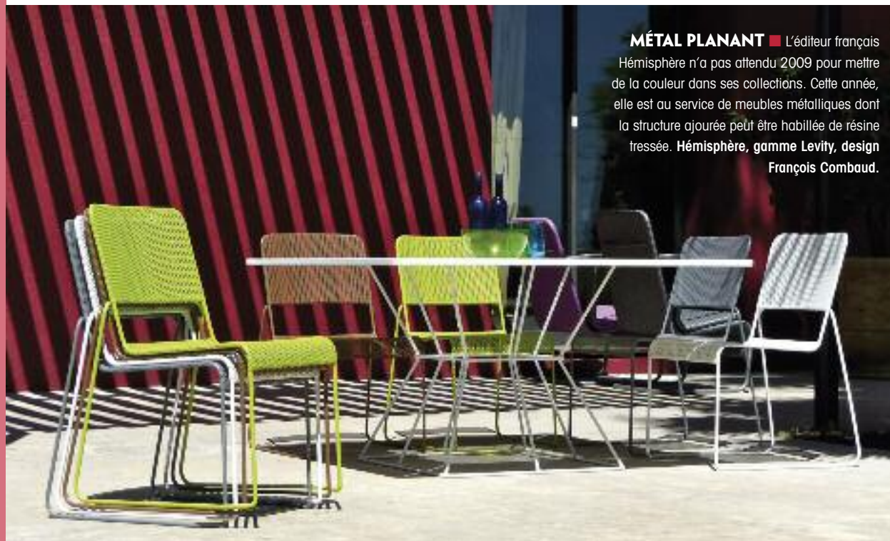
MÉTAL PLANANT ■ L'éditeur français Hémisphère n'a pas attendu 2009 pour mettre de la couleur dans ses collections. Cette année, elle est au service de meubles métalliques dont la structure ajourée peut être habillée de résine tressée. Hémisphère, gamme Levity, design François Combaud.