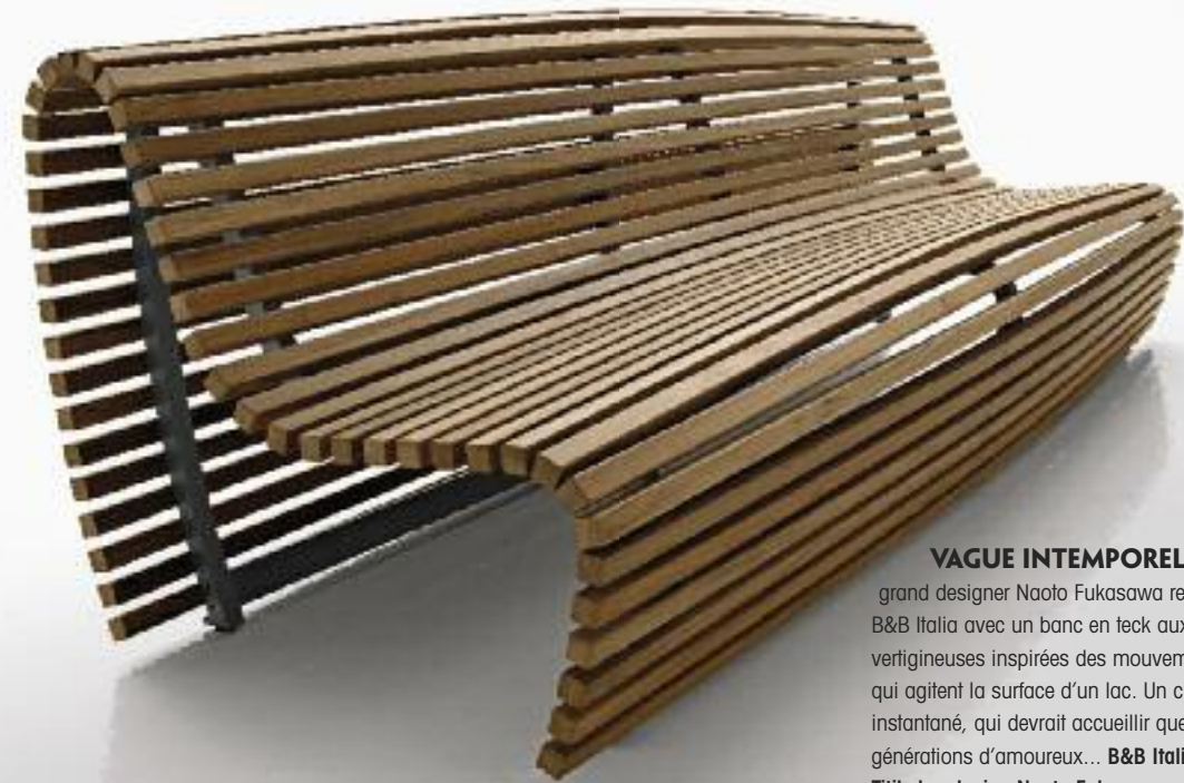
VAGUE INTEMPORELLE ■ Le grand designer Naoto Fukasawa rejoint l'écurie B&B Italia avec un banc en teck aux courbes vertigineuses inspirées des mouvements qui agitent la surface d'un lac. Un classique instantané, qui devrait accueillir quelques générations d'amoureux... B&B Italia, banc Titikaka, design Naoto Fukasawa.

L'ère du jetable est révolue : les éciteurs se tournent vers le design durable, utilisant des matériaux respectueux de l'environnement, créant des objets intemporels inspirés du passé et du présent.